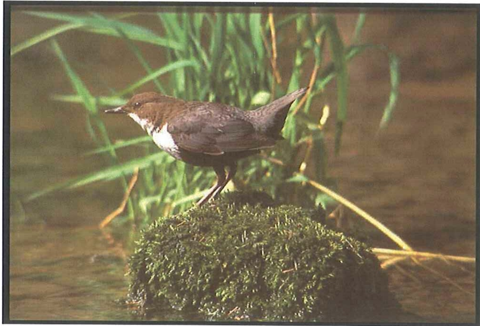
Wasseramsel (Cinclus cinclus)

Kennzeichen: Dunkelbraunes Gefieder mit weißer Brust; kennzeichnendes Knicksen; taucht zur Nahrungssuche; beide Geschlechter gleich.