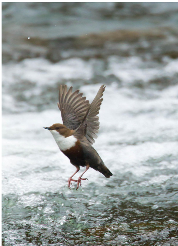
Wasserramsel (Cinclus cinclus)